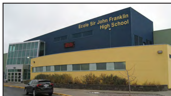
École secondaire Sir John Franklin (9 à 12) 4701 52ième avenue • X1A 2N8 (867) 669-0773 • sjf@yk1.nt.ca Site internet: www.yk1.nt.ca/sjf Facebook: @yk1sjf