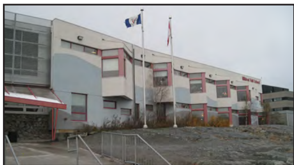
École Mildred Hall (prém. à 8) 5408 50ième avenue • X1A 1E5 (867) 873-5811 • mhs@yk1.nt.ca Site internet: www.yk1.nt.ca/mhs Facebook: @yk1mhs