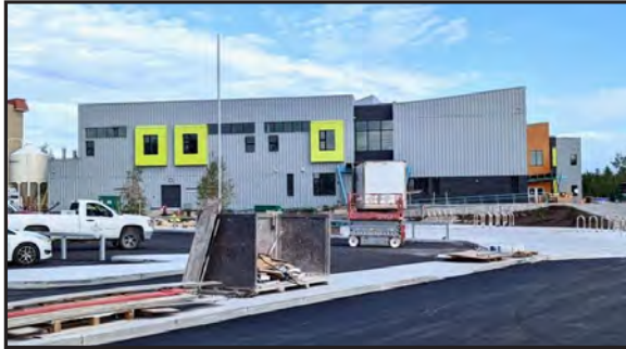
École It'ò (JK-5) 5700 51A Avenue • X1A 1G7 (867) 873-3477 • itlo@yk1.nt.ca Website: www.yk1.nt.ca/itlo Facebook: @yk1itlo