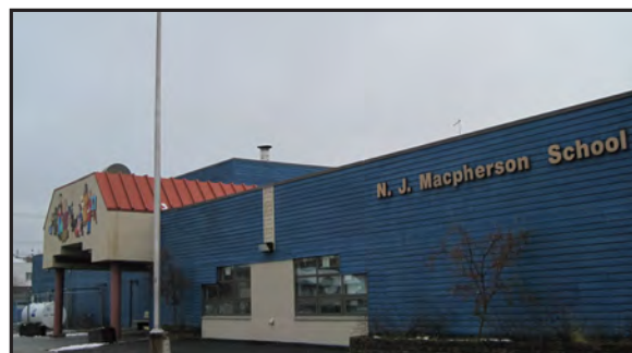
École N.J. Macpherson (prém. à 5) 525 rue Range Lake • X1A 3X1 (867) 873-4372 • njm@yk1.nt.ca Site internet: www.yk1.nt.ca/njm Facebook: @yk1njm