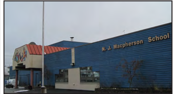
N.J. Macpherson School (JK-5) 525 Range Lake Road • X1A 3X1 (867) 873-4372 • njm@yk1.nt.ca Website: www.yk1.nt.ca/njm Facebook: @yk1njm