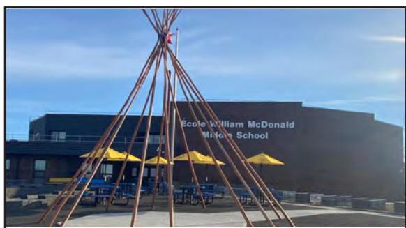
École intermédiaire William McDonald (6 à 8) 50 rue Taylor • X1A 3X2 (867) 873-5814 • wms@yk1.nt.ca Site internet: www.yk1.nt.ca/wms Facebook: @yk1wms