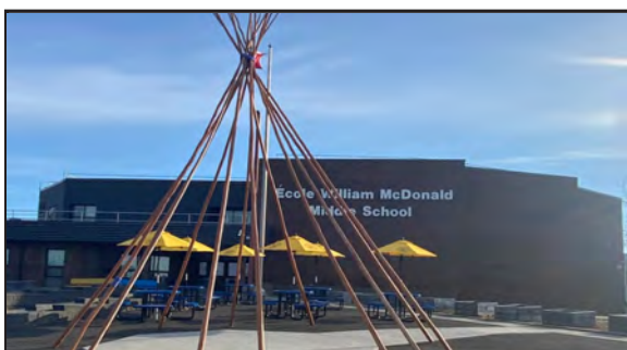
École William McDonald Middle School (6-8) 50 Taylor Road • X1A 3X2 (867) 873-5814 • wms@yk1.nt.ca Website: www.yk1.nt.ca/wms Facebook: @yk1wms