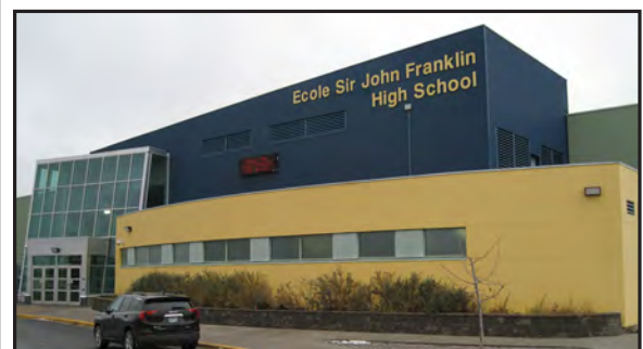
École Sir John Franklin High School (9-12) 4701 52 Avenue • X1A 2N8 (867) 669-0773 • sjf@yk1.nt.ca Website: www.yk1.nt.ca/sjf Facebook: @yk1sjf