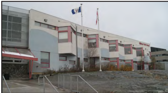
Mildred Hall School (JK-8) 5408 50 Avenue • X1A 1E5 (867) 873-5811 • mhs@yk1.nt.ca Website: www.yk1.nt.ca/mhs Facebook: @yk1mhs