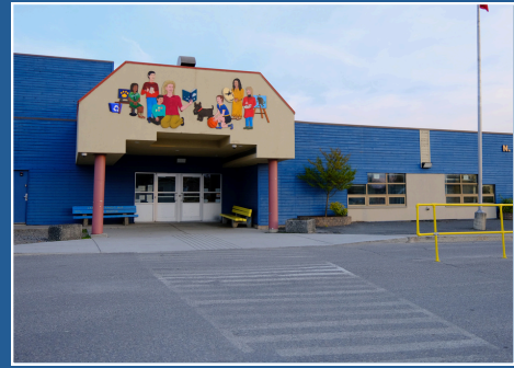
N.J. Macpherson School (JK-5) 525 Range Lake Road • X1A 3X1 (867) 873-4372 • njm@yk1.nt.ca Website: www.yk1.nt.ca/njm Facebook: @yklnjm