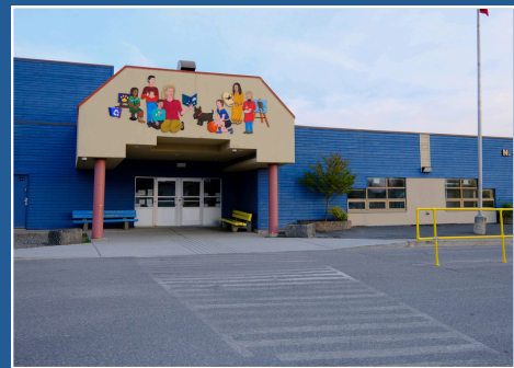
École N.J. Macpherson (prém. à 5) 525 rue Range Lake • X1A 3X1 (867) 873-4372 • njm@ykl.nt.ca Site internet: www.ykl.nt.ca/njm Facebook: @yklnjm