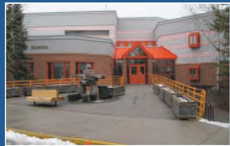
Range Lake North School (JK-8) 170 Borden Drive • X1A 3R1 (867) 920-7567 • rln@yk1.nt.ca Website: www.yk1.nt.ca/rln Facebook: @yklrln