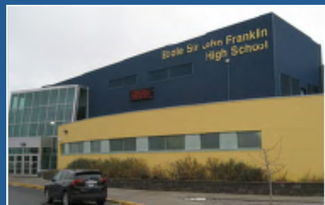
École secondaire Sir John Franklin (9 à 12) 4701 52ième Avenue • X1A 2N8 (867) 669-0773 • sjf@ykl.nt.ca Site internet: www.ykl.nt.ca/sjf Facebook: @ykljsjf