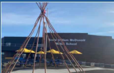
École William McDonald Middle School (6-8) 50 Taylor Road • X1A 3X2 (867) 873-5814 • wms@yk1.nt.ca Website: www.yk1.nt.ca/wms Facebook: @yklwms