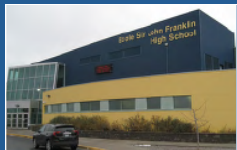
École Sir John Franklin High School (9-12) 4701 52 Avenue • X1A 2N8 (867) 669-0773 • sjf@yk1.nt.ca Website: www.yk1.nt.ca/sjf Facebook: @yklisjf