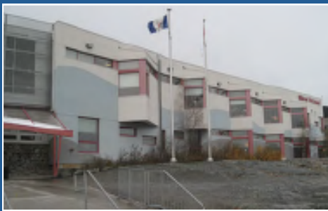
Mildred Hall School (JK-8) 5408 50 Avenue • X1A 1E5 (867) 873-5811 • mhs@yk1.nt.ca Website: www.yk1.nt.ca/mhs Facebook: @yklmhs