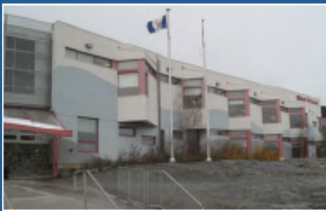
École Mildred Hall (prém. à 8) 5408 50ième avenue • X1A 1E5 (867) 873-5811 • mhs@ykl.nt.ca Site internet: www.ykl.nt.ca/mhs Facebook: @yklmhs