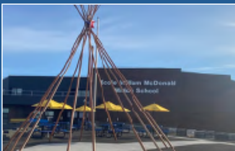
École intermédiaire William McDonald (6 à 8) 50 rue Taylor • X1A 3X2 (867) 873-5814 • wms@ykl.nt.ca Site internet: www.ykl.nt.ca/wms Facebook: @yklwms