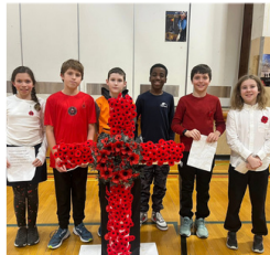
Ecole William McDonald Middle School