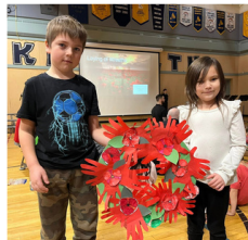
Range Lake North School