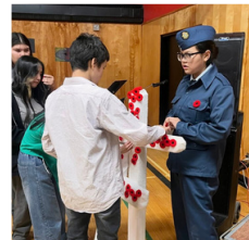
Mildred Hall School

We were also thrilled to celebrate the annual Wade Hamer Hockey Challenge Cup! Congratulations to École Sir John Franklin High School athletes for their strong performance, with the boys putting up a great fight against St. Pat's in overtime and the girls successfully defending their championship. All athletes displayed incredible energy, effort and enthusiasm.