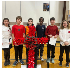
École William McDonald Middle School