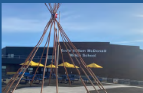
École William McDonald Middle School (6-8) 50 Taylor Road • X1A 3X2 (867) 873-5814 • wms@yk1.nt.ca Website: www.yk1.nt.ca/wms Facebook: @yklwms