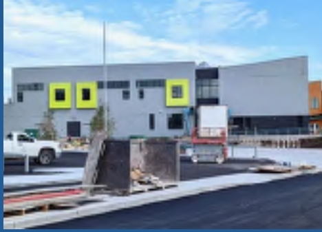
École Itl'ò (prém. à 5) 5700 51A Avenue • X1A 1G7 (867) 873-3477 • itlo@yk1.nt.ca Site internet: www.yk1.nt.ca/itlo Facebook: @yklitlo