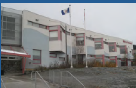
Mildred Hall School (JK-8) 5408 50 Avenue • X1A 1E5 (867) 873-5811 • mhs@yk1.nt.ca Website: www.yk1.nt.ca/mhs Facebook: @yklmhs