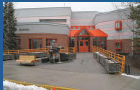
École Range Lake North (prém. à 8) 170 rue Borden • X1A 3R1 (867) 920-7567 • rln@yk1.nt.ca Site internet: www.yk1.nt.ca/rln Facebook: @yklrln