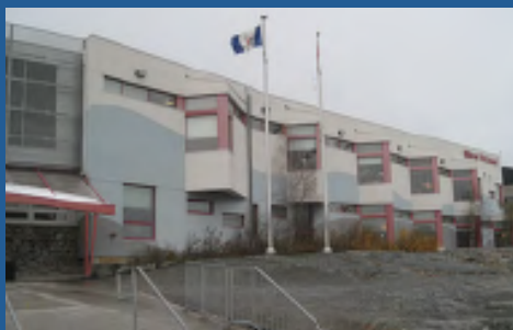
École Mildred Hall (prém. à 8) 5408 50ième avenue • X1A 1E5 (867) 873-5811 • mhs@yk1.nt.ca Site internet: www.yk1.nt.ca/mhs Facebook: @yklmhs