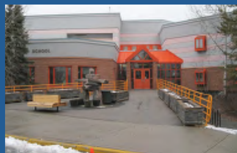
Range Lake North School (JK-8) 170 Borden Drive • X1A 3R1 (867) 920-7567 • rln@yk1.nt.ca Website: www.yk1.nt.ca/rln Facebook: @yklrln