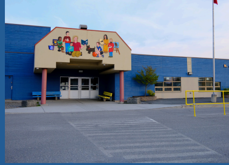
École N.J. Macpherson (prém. à 5) 525 rue Range Lake • X1A 3X1 (867) 873-4372 • njm@yk1.nt.ca Site internet: www.yk1.nt.ca/njm Facebook: @yklnjm