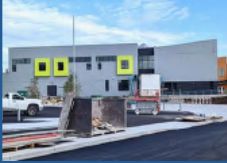
École Iti'ò (JK-5) 5700 51A Avenue • X1A 1G7 (867) 873-3477 • itlo@yk1.nt.ca Website: www.yk1.nt.ca/itlo Facebook: @yklitlo