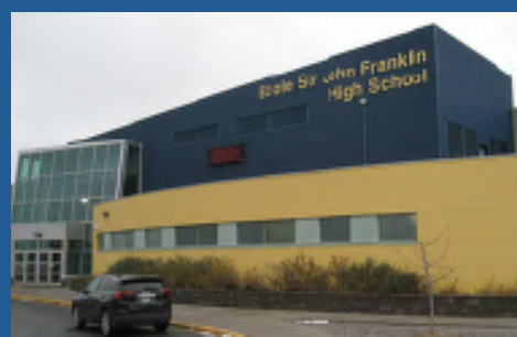
École secondaire Sir John Franklin (9 à 12) 4701 52ième Avenue • X1A 2N8 (867) 669-0773 • sjf@yk1.nt.ca Site internet: www.yk1.nt.ca/sjf Facebook: @ykl1sjf