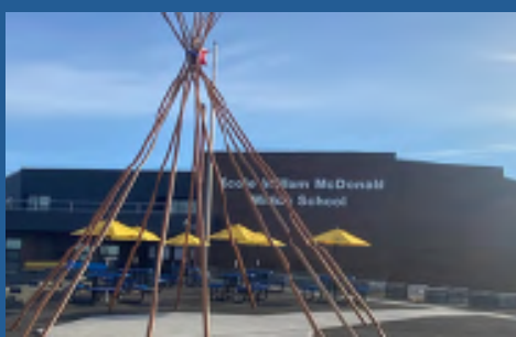
École intermédiaire William McDonald (6 à 8) 50 rue Taylor • X1A 3X2 (867) 873-5814 • wms@yk1.nt.ca Site internet: www.yk1.nt.ca/wms Facebook: @yklwms