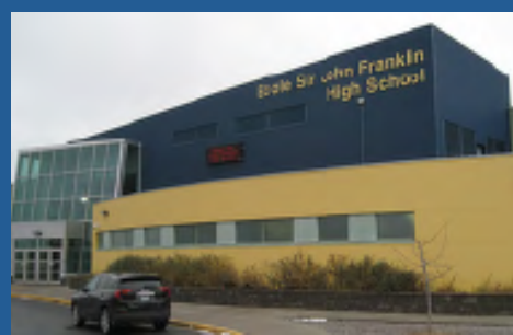
École Sir John Franklin High School (9-12) 4701 52 Avenue • X1A 2N8 (867) 669-0773 • sjf@yk1.nt.ca Website: www.yk1.nt.ca/sjf Facebook: @yklisjf