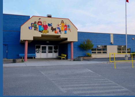
N.J. Macpherson School (JK-5) 525 Range Lake Road • X1A 3X1 (867) 873-4372 • njm@yk1.nt.ca Website: www.yk1.nt.ca/njm Facebook: @yklnjm